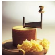
„Tête de moine“