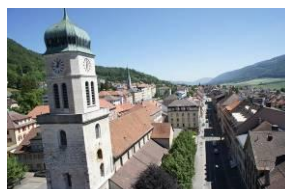
Collégiale von St-Imier