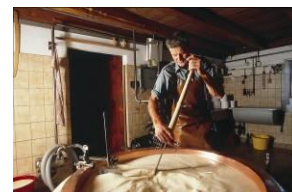
Herstellung des „Gruyère d'alpage“

Sonntag Individuelle Anreise & Begrüssung 18:00 Uhr: Ankunft Gemeinsames Abendessen Kennenlernen, Infos zum Ablauf der Woche