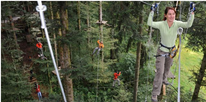
Sport: Die Welt aus der Eichhörnchenperspektive im Seilpark Gantrisch