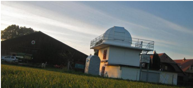
Musée: Im Naturpark beweisen wir Weitblick - mit vier Sternbeobachtungspunkten, hier die Sternwarte Uecht