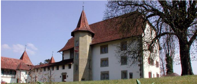
Kultur: Wieso nicht eine Schnupperlehre als Burgfräulein oder Schlossherr in Schwarzenburg?