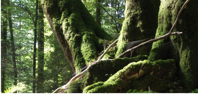
Natur: Mit der Waldarena wird eine Wanderung durch die Gantrischer Wälder zur Safari