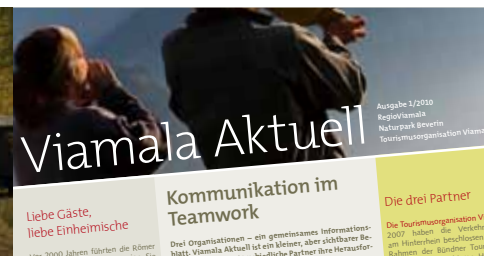
Ein Welterbe zum erleben