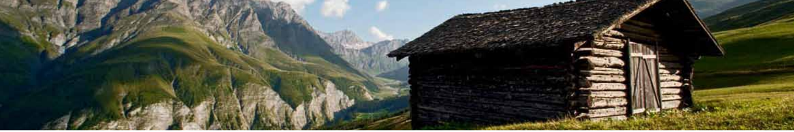
Authentische Werte: Walsertal im Safiental