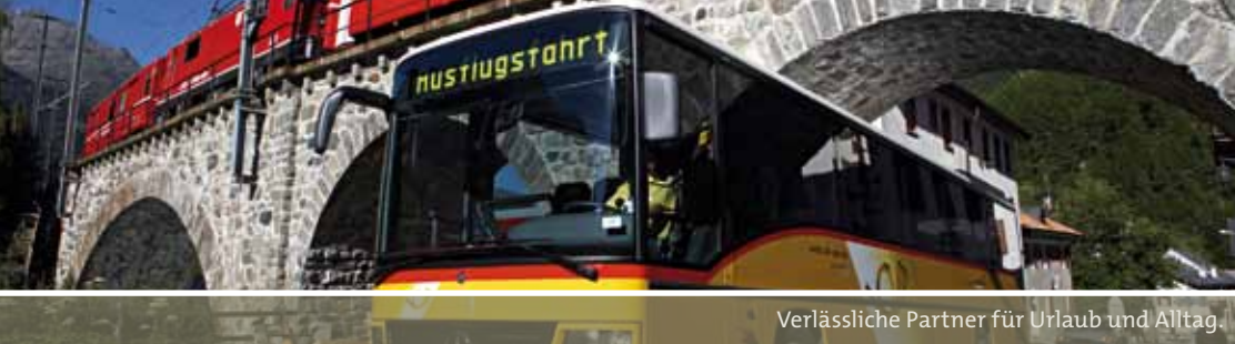
Verlässliche Partner für Urlaub und Alltag.