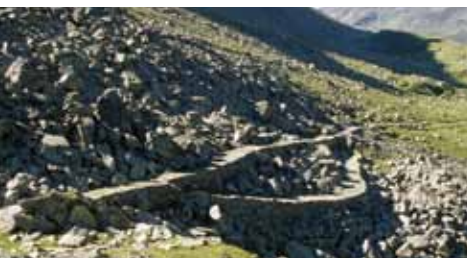
Erfolgspfad via Spluga

Die Bevölkerung der Gemeinde Tschappina macht's vor: Sie hat aus Eigeninitiative bereits eine Naturpark-Arbeitsgruppe eingesetzt und arbeitet themenübergreifend an Ideen und Projekten für den Naturpark Beverin. Nun geht es darum, im Schams sowie im Safiental weitere Naturpark-Arbeitsgruppen aufzubauen, die in den Handlungsfeldern «Produkte, Angebote, Umweltbildung», «Landschaft, Kultur, Natur» und «Erneuerbare Energien» mitarbeiten und neue Projektideen entwerfen. Alle Interessierten sind herzlich zum Infoanlass am Mittwoch, 26. Mai um 20 Uhr in Wergenstein eingeladen. Der Termin für die Veranstaltung im Safiental wird noch bekannt gegeben. Weitere Infos erhalten Sie über www.naturpark-beverin.ch oder bei der Geschäftsstelle Naturpark Beverin, 081 630 70 83.