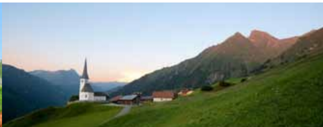
Tenna. Schon bald mit Solarskilift.