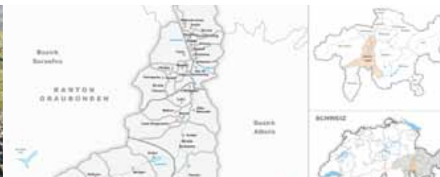
Von der Vision zur Realität