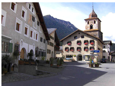
Bergün im Parc Ela

Bitte meldet der Geschäftsstelle Eure Beispiele zu den beiden Themen. Danke.